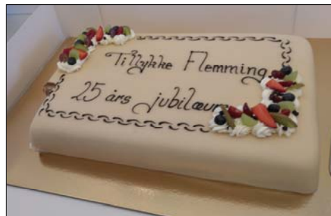
Den særdeles festlige lagkage -