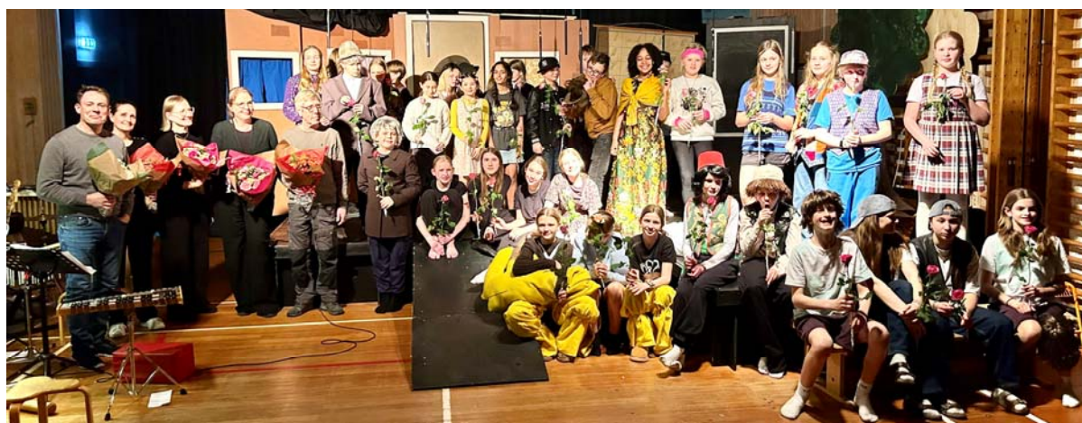
Hele holdet bag teaterforestillingen

De bedste forårshilsner fra Tybjerg Privatskole og skolebestyrelsen