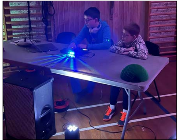
Diskofest og slikbod for de yngste elever