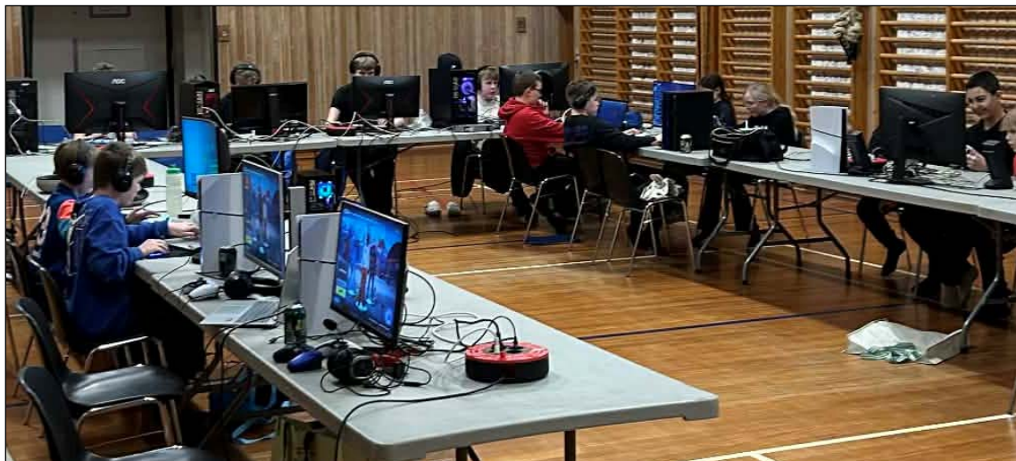
Gameraften for 4.-8. klasserne