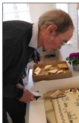
- som Flemming skar for