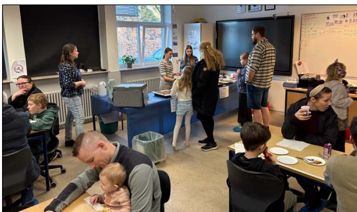
Teaterbar arrangeret af 7. klasse

Tekst: Julie Kronbach-Andersen. Fotos: Jacob Quaade og Michael Lindquist (teatercaféen)